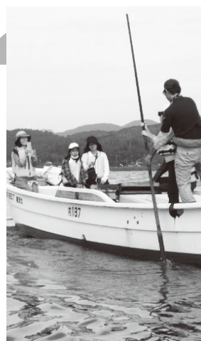
▲シジミ漁体験会の様子