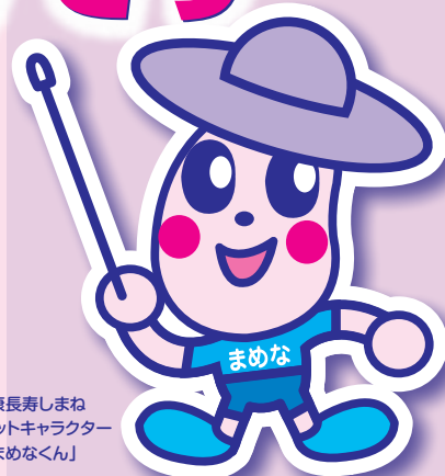
健康長寿しまね マスコットキャラクター 「まめなくん」