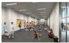
メインアリーナと繋がる会議室