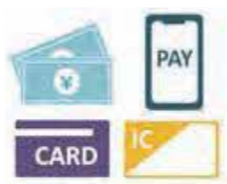
様々な支払方法に対応