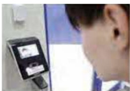
顔認証システムの導入