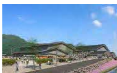
緑地・憩いの場と体育館