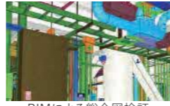
BIMによる総合図検証