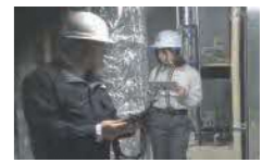
隠ぺい部の確認（BIMの活用）