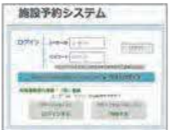
独自予約システムの導入