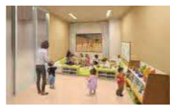
使いやすいキッズルーム