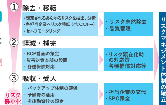
3つのリスク管理方針