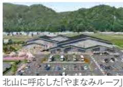
北山に呼応した「やまなみルーフ」