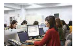
24時間コールセンター