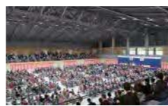
メインアリーナ（成人式開催）