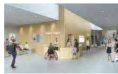
見通しが効くエントランスホール