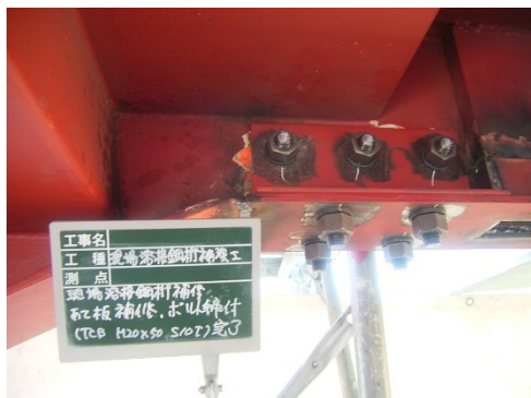
写真3-1 当て板取付状況

激しい腐食による鋼部材の減厚が生じた箇所に対し、腐食箇所を取り囲むように当て板等を取り付けることにより鋼部材を補修する工法です。