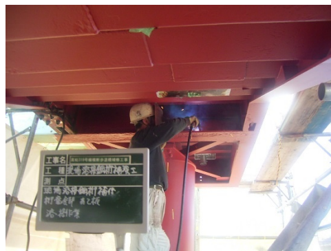
写真3-2 当て板溶接状況