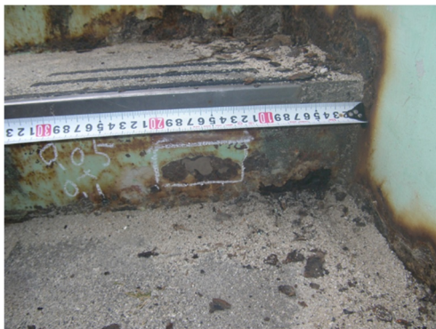
腐食（階段部蹴上げ）