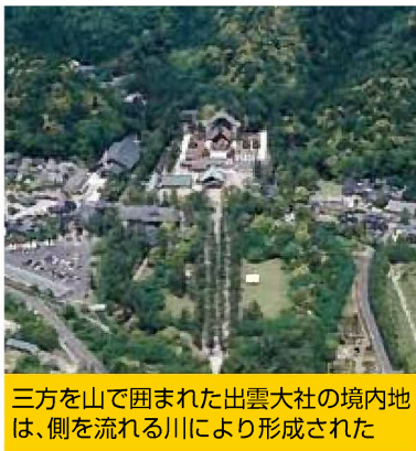
三方を山で囲まれた出雲大社の境内地は、側を流れる川により形成された

土器や遺構のみならず、発掘調査地の土層も私達に多くの事実を伝えてくれます。(三原一将)