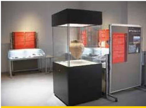
ギャラリー展のようす

寺の境内の発掘調査が行われたのは、今から31年前の昭和57年(1982)〜昭和59年(1984)のことです。その後、寺の東側や北側の調査も行われました。今回は、発掘調査から30年が経