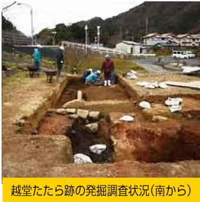
越堂たたら跡の発掘調査状況(南から)