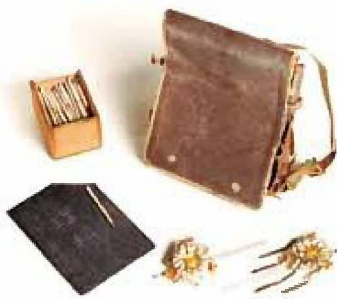
明治時代の学校用品と簪(かんざし)

★ギャラリー展示 2月19日(水)～6月2日(月) 斐川地域の横穴墓 よこあなば 【観覧無料・ぜひ「期待！」】 出雲市は、斐川町直江の工業団地予定地で発掘調査をしています。調査では、山の斜面に穴を掘った横穴墓15基からなる杉沢横穴墓群を見つけました。これらは、およそ1350年前の集団墓地です。ところで、今から30年前にもここから北に700mの場所で横穴墓群が調査されています。それは、19基が見つかった平野横穴墓群です。 この2つの横穴墓群が営まれた丘陵は、今は江戸時代に掘られた旧新川の河道で南北に分断されていますが、それ以前は一続きだったと思われます。 同じ丘陵地に墓を造った人たちは、どこで暮らし、どのような関係にあったのでしょうか。出雲平野の他の横穴墓との共通点や相違点を明らかにしながら、当時の地域社会について考えていきたいと思えます。