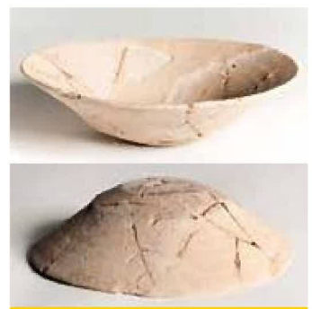
底が削られた土師器(矢野遺跡)

矢野遺跡で見つかった底が削られた土師器の内側の中央には、月山富田城跡出土の京都系土師器にも見られる円形の窪みが見られます。この窪みは本場の京都系土師器の窪みを真似たもので、このことは、底が削られた土師器が外形だけでなく、内側も京都系土師器に近づけようとしたことを示し