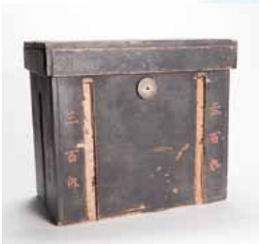
高野寺所蔵大般若経経櫃 (縦 35cm、横 57cm、高さ 50cm)