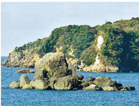
大岩が積み上がった つぶて岩 (中央の石の高さは約10m)

つぶて岩は、国譲りに反対したオオクニヌシの子・タケミナカタと、高天原の使者・タケミカツチが力比べをし、投げ合った石が積み上がったものと言われられています。大岩が積み上がる不思議な光景は、まさに神業。近くの展望台から、夕日とともに眺めるのもおすすめです。(景山このみ)