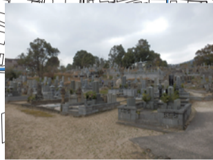
墓の転倒の恐れあり