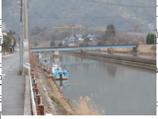
堀川に近く標高も低い