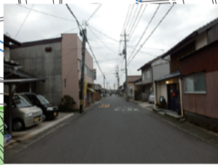
昭和21年頃の南海地震により倒壊、死者あり(馬場通り)