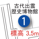
県立古代出雲博物館 標高 3.5m