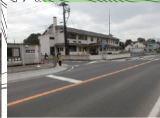
大社警察署 標高が低い