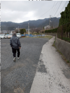
大社小学校 西 → 上玄光院