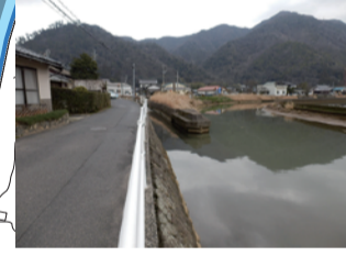
川の曲部 GL 最低部 標高 3.8m