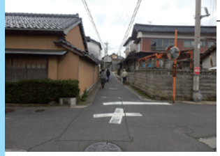
大土地町内から上大土地への避難通路