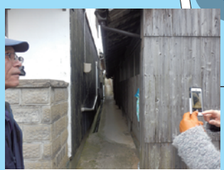
狭すぎる小路 (危険)