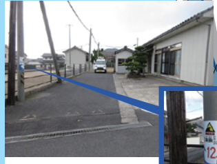
上大土地公会堂 消防コミセン (避難地区：上・下大土地、小土地3区、永徳寺坂)