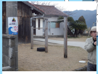
円通寺 (避難地区：小土地2区)