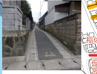
中村仮の宮地区の狭い路