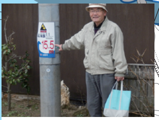
一番高い地点 赤塚高原 (たかばら) (避難地区：赤塚、小土地1区)