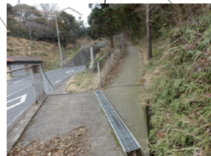
第4班の宮前側からの避難所。通学路ではあるが勾配がきつい