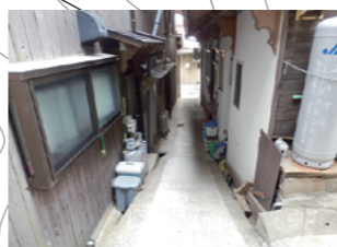
狭く段差があり要注意