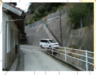
山へ一時避難(永見前)