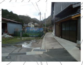
家が崩れる恐れあり道が狭い