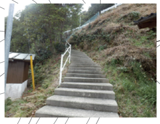
福性寺横から県道に登る急な階段・段数が多い