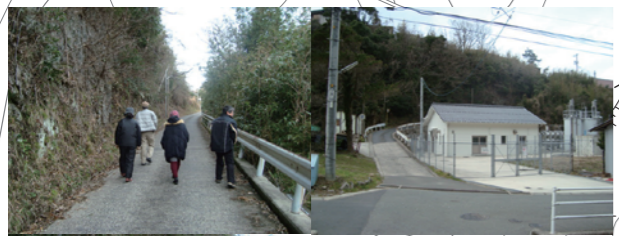
コミセンへの避難経路道が崩れる危険あり