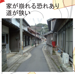
家が崩れる恐れあり道が狭い

この「地域津波避難計画」は、平成 26 年に、地域の皆様により作成された計画を更新したものです。この計画では、「島根県の津波浸水想定」「出雲市津波ハザードマップ」よりも津波高を高く想定し作成しています。 ※実際の津波は、発生場所や地形等の条件により、浸水範囲や津波高が想定より大きくなる可能性があります。