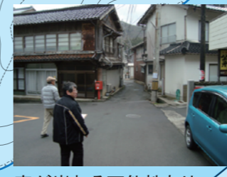
家が崩れる可能性あり