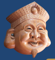
C-2 いずもいっとうぼり 出雲一刀彫 ふじまる工芸 ☎ 0853-22-5600

「八雲（やくも）塗り」の漆器は使うほどに色味や風合いが変わり、その魅力が際立ちます。