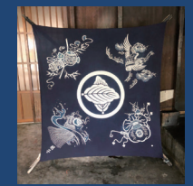
ながたせんこうじょう 長田染工場 C-2 ☎ 0853-21-0288