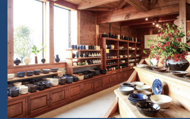
しゅっさいがま 出西窯 C-2 ☎ 0853-72-0239