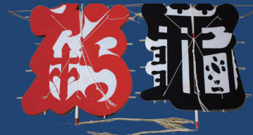
たいしや いかにだこたかはし 大社の祝風 高橋 B-1 ☎ 0853-53-1553