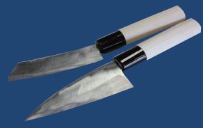
C-3 たかはしかじや 高橋鍛冶屋 ☎ 0853-48-0885