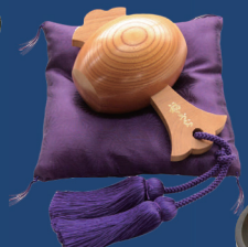
B-1 たいしやもっこう 大社木工 ☎ 0853-53-2247