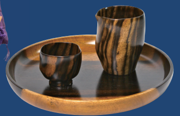
C-2 もくげい おかや木芸 ☎ 0853-72-0538