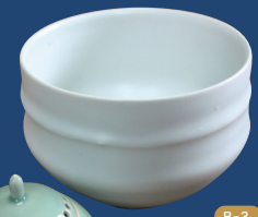
たちくえやきこうぼう 立久恵焼工房 B-3 ☎ 0853-45-0563