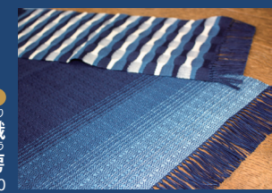
C-2 しよっさいおり 出西織 たたのこうぼう 多々納工房 ☎ 0853-72-3120