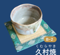
B-2 くむらやき 久村焼 ☎ 0853-86-3229