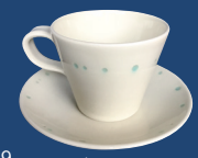
こうぼう 工房のつ A-2 ☎ 0853-86-3452