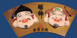
まつうらふくじんめんせいさくしよ 松浦福神面製作所 B-1 ☎ 0853-53-2368