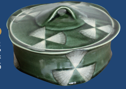
C-2 せいろうんがま 青雲窯 ☎ 0853-21-3785