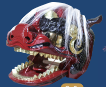
C-2 ちようこくこうげいなかお 彫刻工芸中尾 ☎ 0853-23-0666