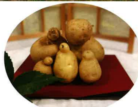
じゃがいものお地藏様が五体。家族のようです。見ているとなんだか手を合わせたくてきます。皆様、今年一年無事で過ごせますように...