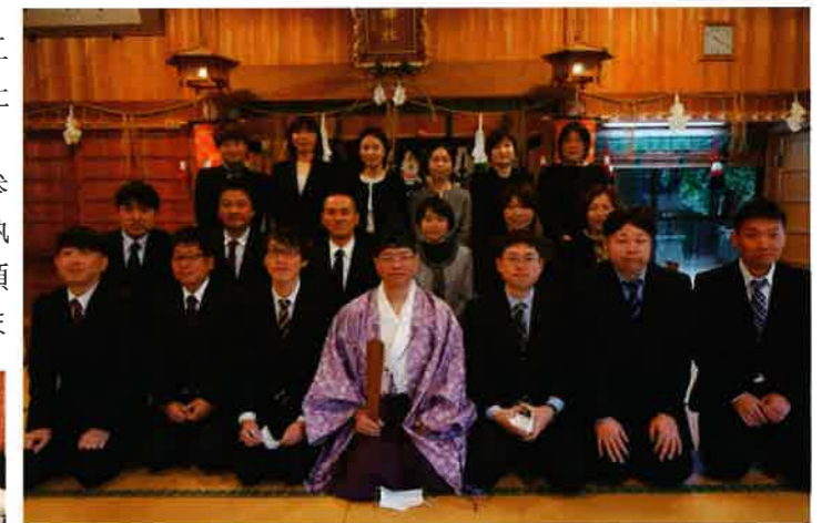
記念撮影をする令和五年上津四十二会の皆様