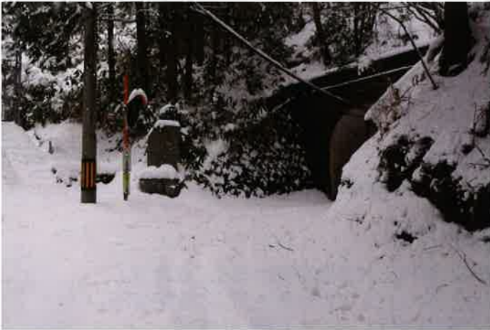
石碑が見えて右がトンネル、あと一息。

奥井谷方面から隧道方面へどんどん歩き、急坂のヘアピンカーブが過ぎ(12月号)、目的地までもう少し。1月末には雪が積もり、こんな時こそ魅惑の新道。除雪してない道には積雪が30センチ弱、歩いて5分もすると大きな倒木で塞がれているのはさすが。くぐり抜けてさらにザクザクとお地蔵様岩(11月号)はくつきり見えて安心したのですが、このあたりは35センチ近くの積雪で歩くのが大変。この直線の急坂は小学生の頃には竹スキーでプイプイ飛ばしていたなあ。ザクザクと進むと風裏になるのか、積雪が20センチくらいになり少し楽に歩けるぞ。ただ長靴の中に雪が入り足が冷たくなり、運動能力が極端に低下。石碑が見えてもうトンネルだ、でも帰りの元気がなくなりそう。ここで凍死は恥ずかしい、勇気を持って引き返すことに。冬も魅惑の新道、新道隧道はあと少し。