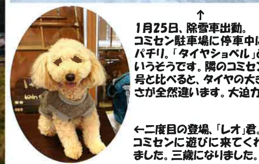
↑ 1月25日、除雪車出動。コミセン駐車場に停車中にパチリ。「タイヤショベル」というそうです。隣のコミセン号と比べると、タイヤの大きさが全然違います。大迫力!