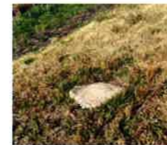
お地藏さまの土台、発見！

3月末のこと、コミセンへ「お地藏さまが落ちています」と連絡があり、職員一同ビックリ!!「どこに?」「何で落ちてるの?」と驚きながら現場付近へ行き、探すこと約30分。「あったー!」なんとそこには排水路に横たわるお地藏さまがいました。見つけたものの、とても人の手では持ち上げることもできない状態。石には文化5年と刻まれています。一刻も早く元の場所へ戻してあげないと、きっとお地藏さまは寒くて凍えているに違いない…。そこで、元いた場所を地区の有識者の方々の話から特定し、土台を見つけました。聞くとところによると、昔は札うちでお参りされていたり、登下校時に手を合わせていた子ども達もいたそうです。現在はポケモンGOのポケストップにもなっていました。