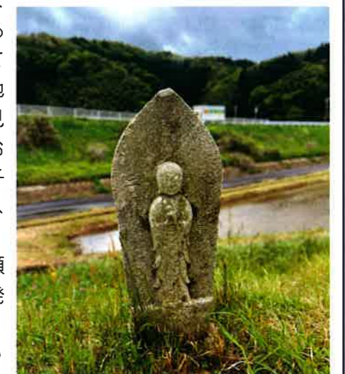
無事に元の位置におさまったお地藏さま。合掌