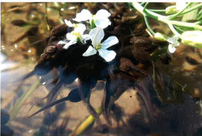
ダイコンの花が美しく似合うオタマの乙女たち

4月終わりのある日、天気も良かったので大谷カエルランドでしばらくの間、水面を観察していました。目の前にはすくすくと大きくなって元気よく泳ぐオタマジャクシ、愛らしくしっぽをふりふりしながら泳いでいます。お腹空いてないかい？推定4万匹のオタマジャクシが暮らしていくためにはたくさんのごはんが必要です。近所の方に人間が食べないようなハクサイやダイコン、カボチャなど（特に腐りかけがおいしい）をいただいてやっています。これらを水面にポチャッと落とすと一瞬は向こうに逃げるのですが1分もすると順番に寄ってきて食べ出すのが見えます。唇を伸ばしてむしゃむしゃ食べる様子、時には裏返ってお腹に透ける腸を見せながら食べる様子、見飽きないなあ。気がつくと1時間が経っていました。