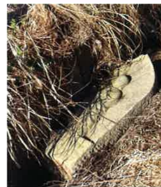
排水路に落ちているお地藏さま