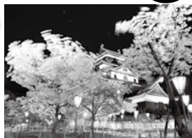
タイトル:春の嵐▲

フォト雲州会員による渾身の写真をご覧ください。右の写真は、風に揺れる夜桜を、シャッタースピードを少し落とし、大きな動きが出るように撮りました。