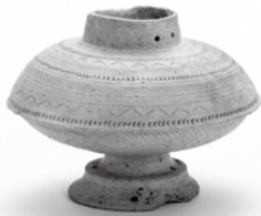
▲下古志遺跡の台付壺

出雲平野では、これまで多くの弥生時代のうつわが発掘されてきました。今回は、形がよく残っているものを中心に、弥生人が使ったうつわを紹介いたします。本展を通して、ぜひ「推しのうつわ」を見つけてみてください。