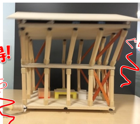
体験型模型【2階建て住宅】 1/20スケール