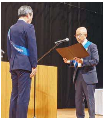
令和7年度 メッセージ伝達式

と ころ ●出雲市民会館大ホール ※メッセージ伝達式終了後啓発講演会を行います。