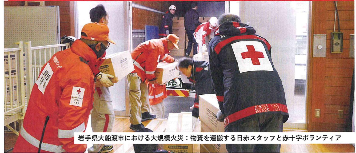
岩手県大船渡市における大規模火災：物資を運搬する日赤スタッフと赤十字ボランティア