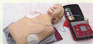
訓練用人形とAEDトレーナー

講習で使う人形や、訓練用AEDなどの教材は、自治会などを通じて皆さまからお寄せいただく日赤会費・寄付金（活動資金）に支えられています。引き続き、ご協力をお願いいたします。