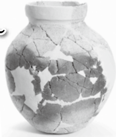
▲中山丘陵遺跡出土の土師器壺