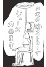
象鼻盃席のイメージ▶

時間/午前の部11:00 午後の部14:00 定員/各25人(無料) 申込方法/当日受付(先着順)