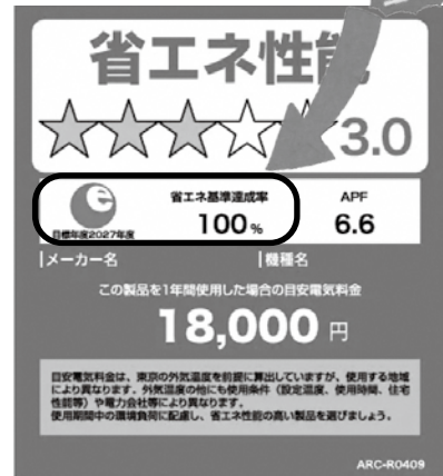
【統一省エネラベル】