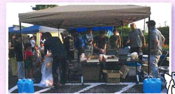
今年の出東子どもたなばたまつりでは、かき氷、から揚げ、フライドポテトを販売

出東わけもん会では、活動に賛同していただけるメンバーを募集しています。私たちと一緒に出東を盛り上げていきませんか!