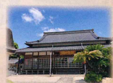
▲宿舎となった出東の寺 写真は保寿寺

著書には、このほか疎開した幼き時代の辛くも楽しかった貴重な体験談が記されている。