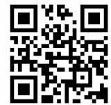
つうえんポータル

右記の二次元コードを読み込み、つうえんポータルにアクセスし、その画面にてお住まいの自治体を選択し、利用申請をしてください。