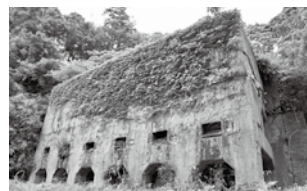
戦時中に航空機製造に必要な原料となる鉄精鉱を採掘した久村鉱山(出雲市多伎町)▲

島根県に空襲被害が集中した昭和20年7月28日、その日何が起こっていたのかを子どもにも分かりやすく展示・解説します。郷土史家、故高塚久志氏を偲び、生前の業績を振り返ります。