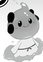
出雲市上下水道局キャラクター 「みずもちゃん」

最近、下水道への異物の流入によるポンプの故障や、油の流入による下水道管の詰まりが頻繁に発生しています。