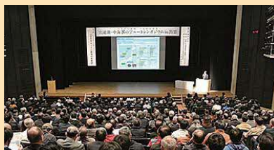
8の字ルートシンポジウム