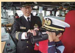
掃海艇はつしま艦艇広報