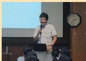
平田高校金融リテラシーセミナー