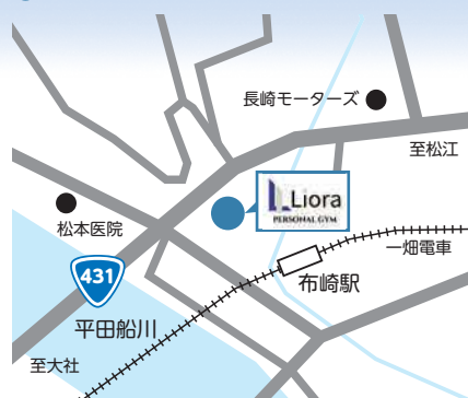
表 紙 紹 介