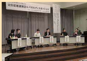
定住促進委員会パネルディスカッション