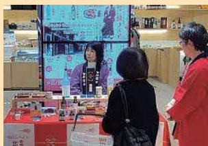
日比谷まね館出店 出雲ご縁フェア