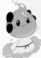
出雲市上下水道局キャラクター「みずもちゃん」

—— おたずね —— 経営企画課 TEL 21-3513 下水道管理課 TEL 21-2226