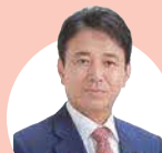
出雲市長 飯塚俊之氏