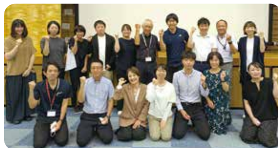
写真：出雲圏域病病連携会議（2005.5月発足） 出雲市内9病院の医師や相談員等で構成し、月1回の定例会を通じて顔の見える関係づくりをしています。