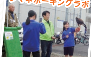
シマネホーキングラボ