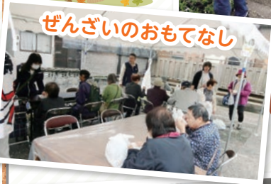
ぜんざいのおもてなし