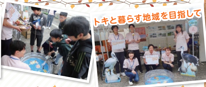
トキと暮らす地域を目指して