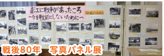
戦後80年 写真パネル展