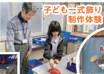
子ども一式飾り制作体験