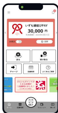
▲アプリ画面のイメージ