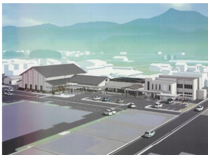
斐川行政センター完成イメージ図 （令和8年10月完成予定）