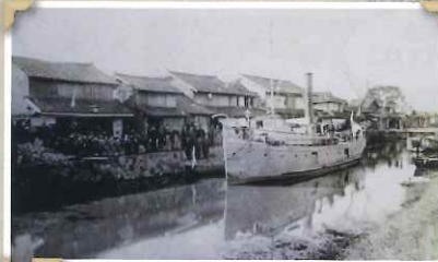
▲松江航路の汽船の船着き場の様子

下の写真は、明治40年(1907)7月の松江-庄原間汽船運航の時刻表です。一日に十往復し、宍道を経由し美保関への便もありました。最終船川で停泊し、翌朝一番が5時50分とあることから、客は前日に庄原町で泊まって出発したことがわかります。