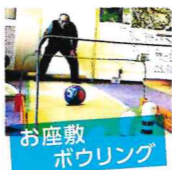
お座敷ボウリング