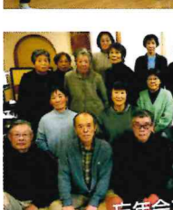
忘年会での集合写真