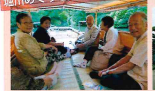
視察研修 バス旅行 堀川めぐりを楽しみました