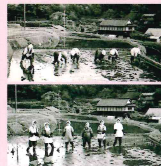
現住地付近の当時の田植えの様子 〳〵 何人かのご存命 〳〵

私が小学5年生の時に、妹とともに朝山小学校(現みなみ小学校)に転校しました。学校の大きさや先生・児童の人数の多さに困惑しておりました。