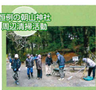
恒例の朝山神社 周辺清掃活動