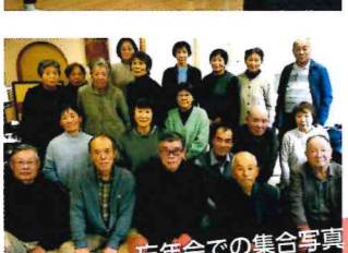
忘年会での集合写真