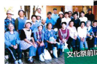
文化祭前にコミセン周回 清掃活動を実施