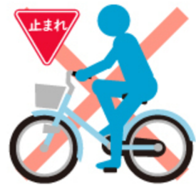
一時停止標識 無視して通過