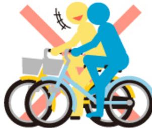
横並びで 自転車で走行