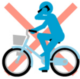
スマホ ながら運転