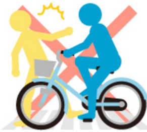
横断歩道で 歩行者優先せず