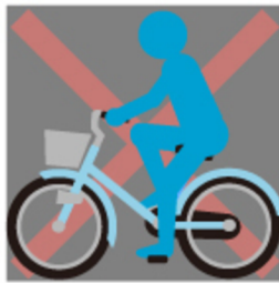
夜にライトを つけないで走行