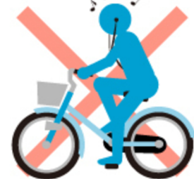
イヤホン 使用運転

「青切符」に該当する違反行為は113種類もあり、違反行為すべてを正しく把握することは困難に感じるかもしれません。