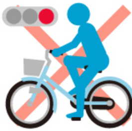
赤信号や 点滅信号無視