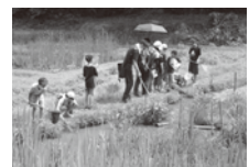
▲里山の生き物観察

時間/9:30～11:00 集合場所/荒神谷博物館前 定員/30名 参加費/200円(未就学児は無料) 申込方法/事前に電話等で申込む