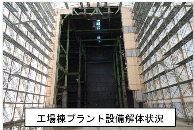
工場棟プラント設備解体状況