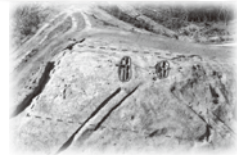
▲結本谷1号墳の全景

出雲平野を望む斐川町の丘陵に多く築かれた古墳には、どのような人々が葬られたのか。その謎に迫ります。