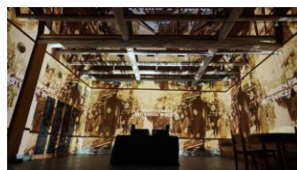
光の演出のイメージ