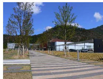
古代出雲歴史博物館