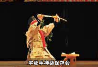
宇那手神楽保存会