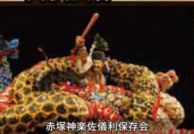
赤塚神楽佐儀利保存会