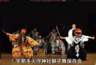
宇那手火守神社獅子舞保存会