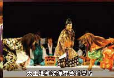
大土地神楽保存会神楽方