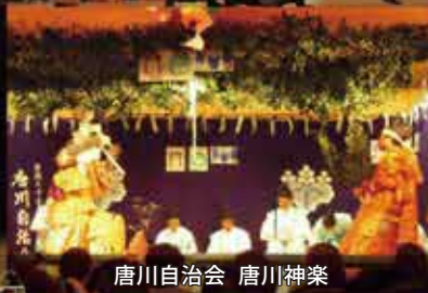
唐川自治会 唐川神楽