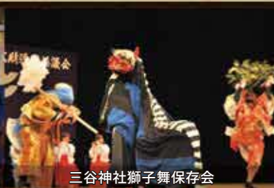
三谷神社獅子舞保存会