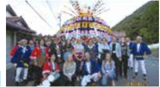
カラヨキ市高校生 来訪時の様子▶

これまで市では、フィンランド国際交流員の招致や、国際感覚を身に着け、国際化社会に対応できる人材育成を目的に、NPO法人出雲フィンランド協会との共催で、中学生・高校生のホームステイによる相互派遣事業を行ってきました。