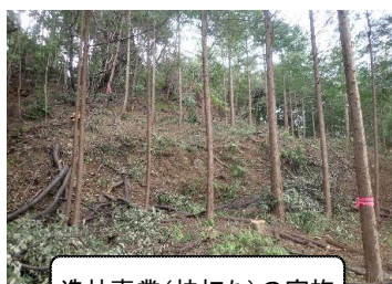
造林事業（枝打ち）の実施