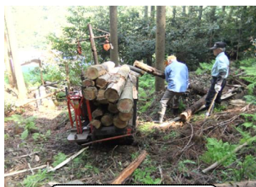
林内作業車の購入