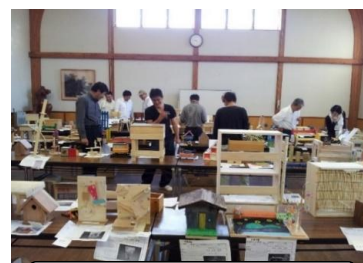
木工工作コンクールの開催