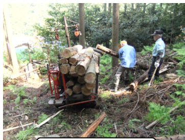
林内作業車の購入