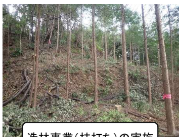
造林事業(枝打ち)の実施