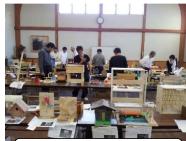
木工工作コンクールの開催