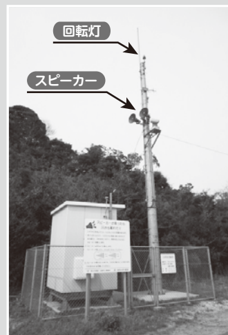
かみくりはら 放流警報局 (大津町上来原地内)