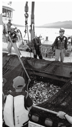
定置網漁見学会の様子