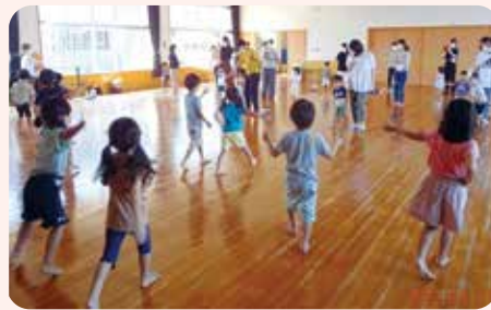
▲年中児と一緒にどうぶつ体操をしましょう 「友達やおうちの人と一緒にどうさんになって 楽しいな！」

子どもたちが明るく元気に育つのを 見ると、未来に希望を感じます。 毎日を心豊かに過ごし、子どもも大人 も、「えがおになあれ」…そんな願いを 込めて、このコーナーを設けました。 (出雲市要保護児童対策地域協議会)