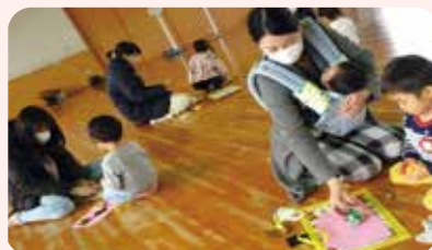
◀いちご教室 おうちの人と ひな人形づくり 「可愛いおひな様を 作っておうちに飾るよ」