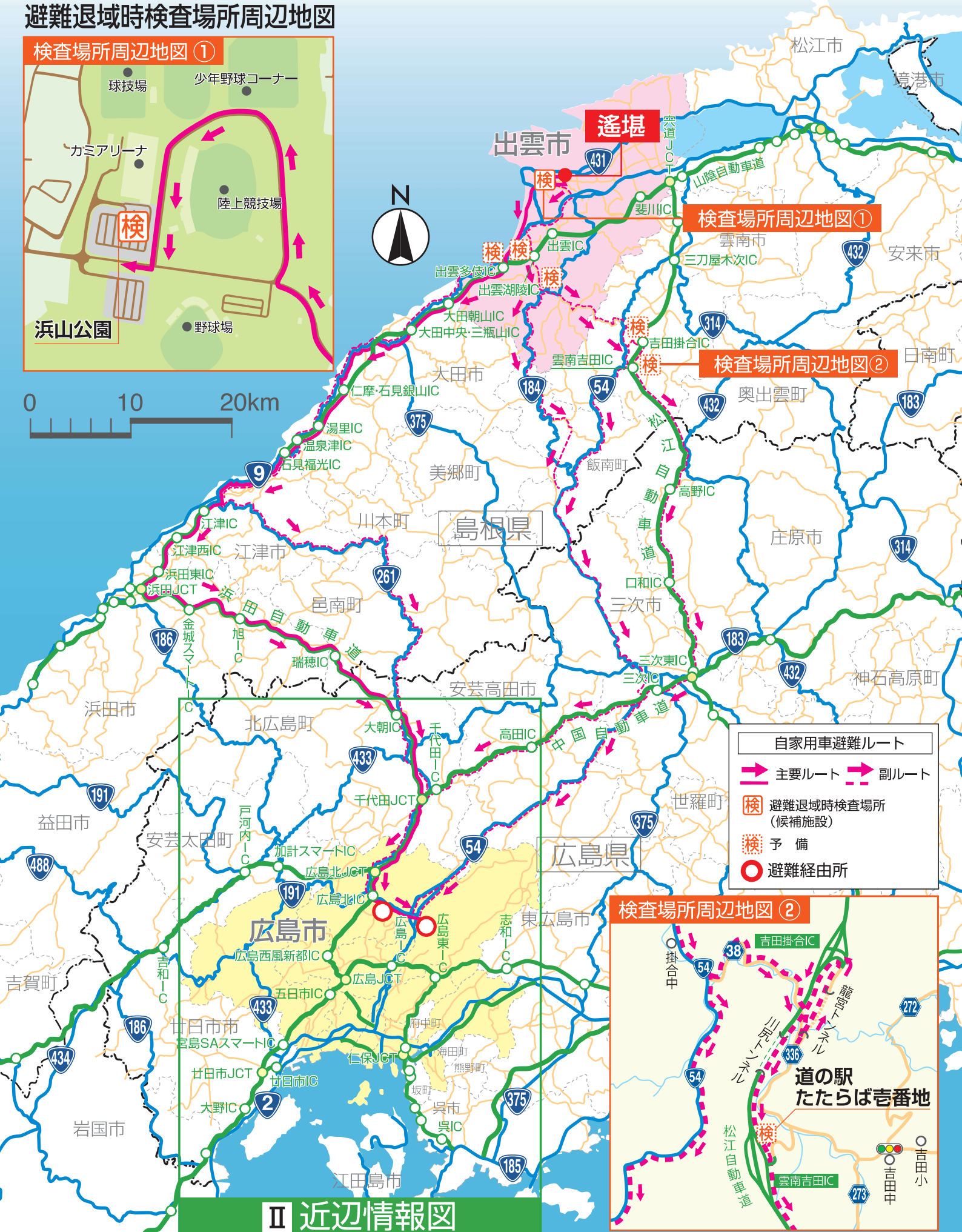
検査場所周辺地図①