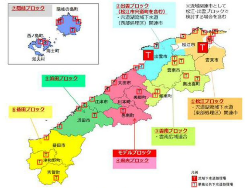
図2 広域化・共同化ブロック割

平成30年度に県と各市町村の担当者による勉強会を行い、令和元年度からは図2に示すブロックごとの検討会を計5回にわたり行った上で、取組の内容を整理し、「島根県汚水処理事業広域化・共同化計画」として取りまとめた。