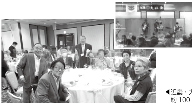
◀近畿・大社会総会の様子です。 約100名の会員が出席しました。