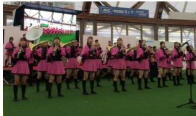
オープニングライブ