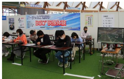
バーチャル企業見学ツアー