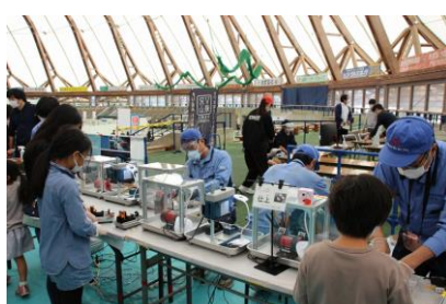
ものづくり体験 （キーホルダーづくり）