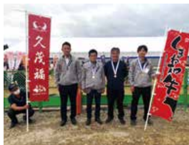
全国1位に輝いた第6区肉牛出品者の皆さん