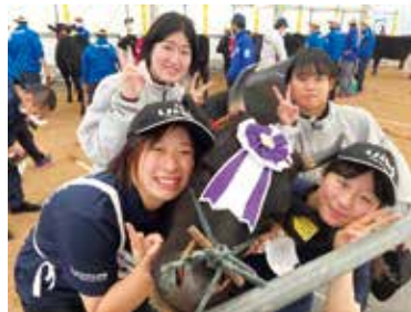
全国5位、特別賞「顔品賞」を受賞した出雲農林高校の生徒さんと「すずらん」号