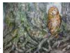
大森幹雄「ふくろう」▶